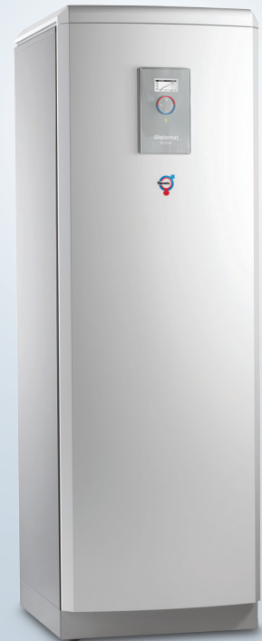
Diplomat Duo Optimum